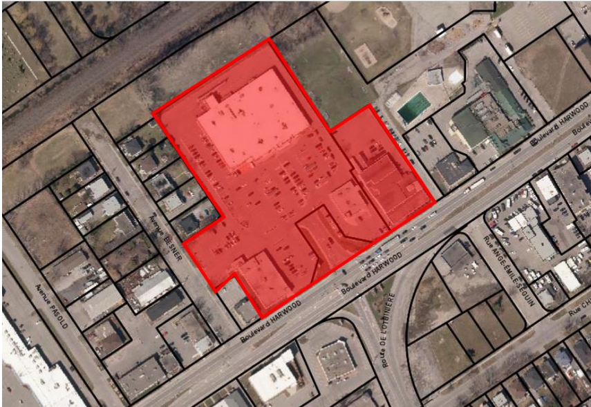
Zone C2-758 (Avant)